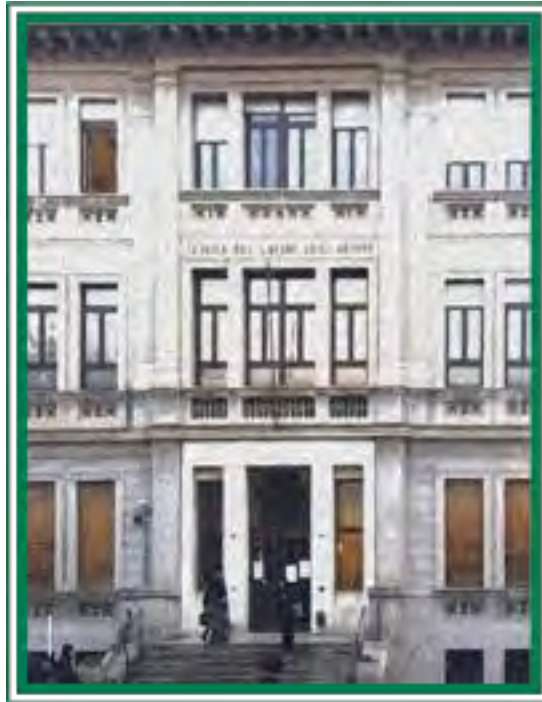
La Clinica del Lavoro di Milano, sede della CIIP dalla fondazione.

Negli ultimi 30 anni alcune Associazioni di professionisti della prevenzione hanno voluto costruire e far crescere un ambito di confronto fra le diverse discipline