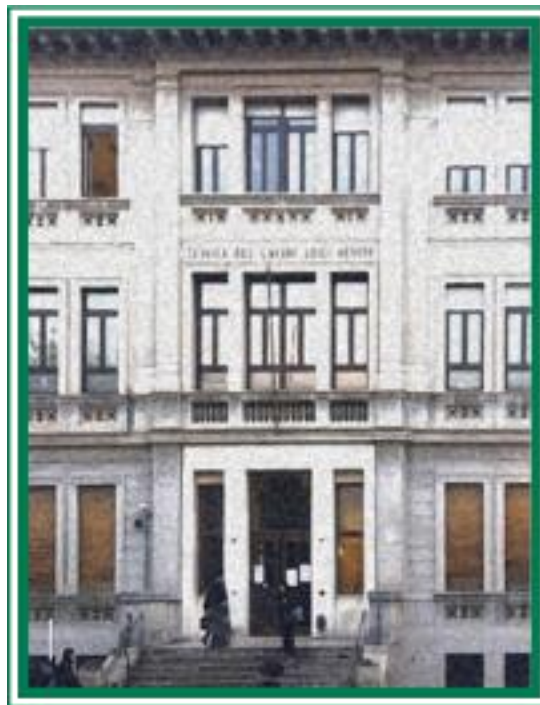
La Clinica del Lavoro di Milano, sede della CIIP dalla fondazione.

Negli ultimi 30 anni alcune Associazioni di professionisti della prevenzione hanno voluto costruire e far crescere un ambito di confronto fra le diverse discipline