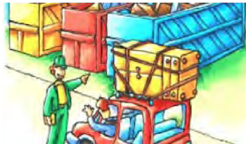
Lab. Igiene Ambient. FP Cgil